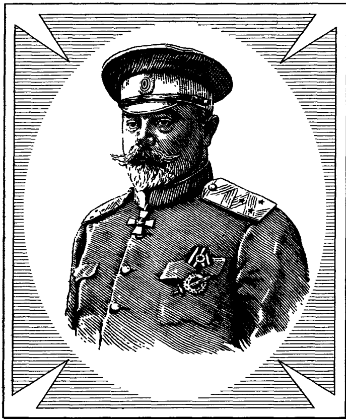
ДЕНИКИН Антон Иванович 1872–1947